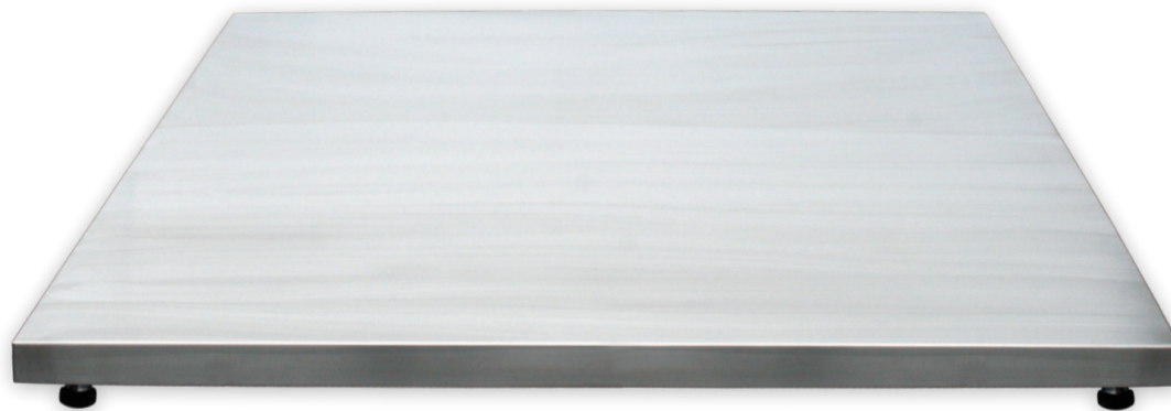
Plataforma de 4 células ▪ Plate-forme avec 4 capteurs ▪ 4 load cells platform